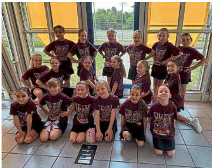
Chiliminis auf der SCC in Haar