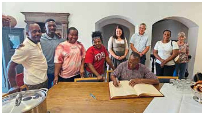
Eintrag ins Goldene Buch der Marktgemeinde Gaimersheim.