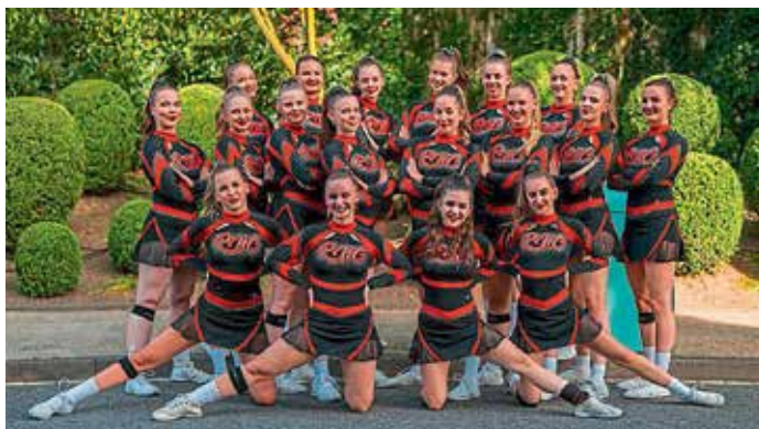
Red Hot Chilis Glow beim ECC