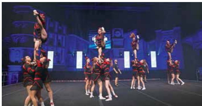
Red Hot Chilis Embers beim ECC in Bottrop