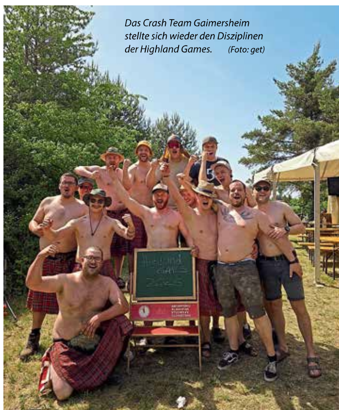
Das Crash Team Gaimersheim stellte sich wieder den Disziplinen der Highland Games.

Die Highland Games sind traditionelle Veranstaltungen mit Wettkämpfen und fanden bereits im 10. Jahrhundert statt. Der Ursprung liegt in der keltischen Tradition und stammt aus der Zeit der keltischen Könige in Schottland. Sie waren Bestandteil der Treffen schottischer Clans in den Highlands und wurden ausgetragen, um die stärksten und schnellsten Männer Schottlands zu finden. Diesen Aufgaben stellte sich auch das Crash Team Gaimersheim und veranstaltete ihr jährliches Mitgliederfest im Steinbruch in Lippertshofen. Zu diesen Feierlichkeiten gehörten auch heuer wieder die traditionellen Highland Games. In den verschiedenen Disziplinen zeigten die Männer ihre Stärken und Kräfte. Zuerst marschierten sie in den dafür vorgesehenen Gewändern ein und losten anschließend die Gruppen aus. Dabei mussten Aufgaben wie „Baumstamm werfen“, „nageln“, „kegeln“ oder „Tau ziehen“ bewältigen. Auch ein Hindernislauf war Teil der Highland Games. Die Spiele dauerten bis zum späten Nachmittag und bereiteten wie jedes Jahr eine Menge Spaß. Zum Schluss gab es eine feierliche Siegerehrung und der Abend klang mit einer Brotzeit in gemütlichem Beisammensein aus. (get)