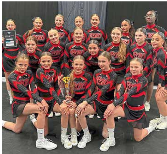
Team Flare mit dem verdienten dritten Platz auf der SCC