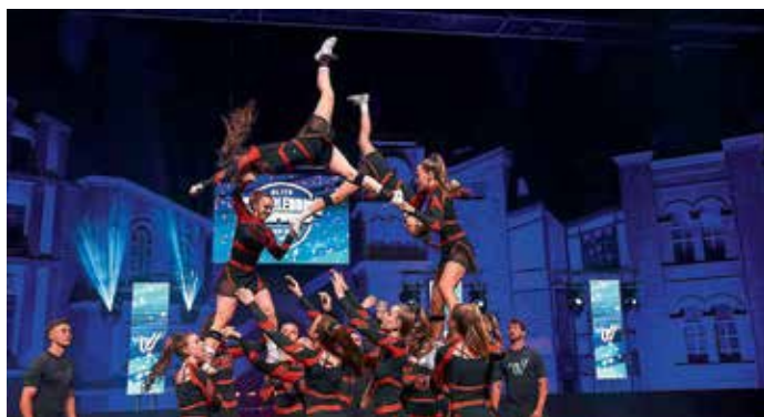
Red Hot Chilis Glow beim ECC in Bottrop