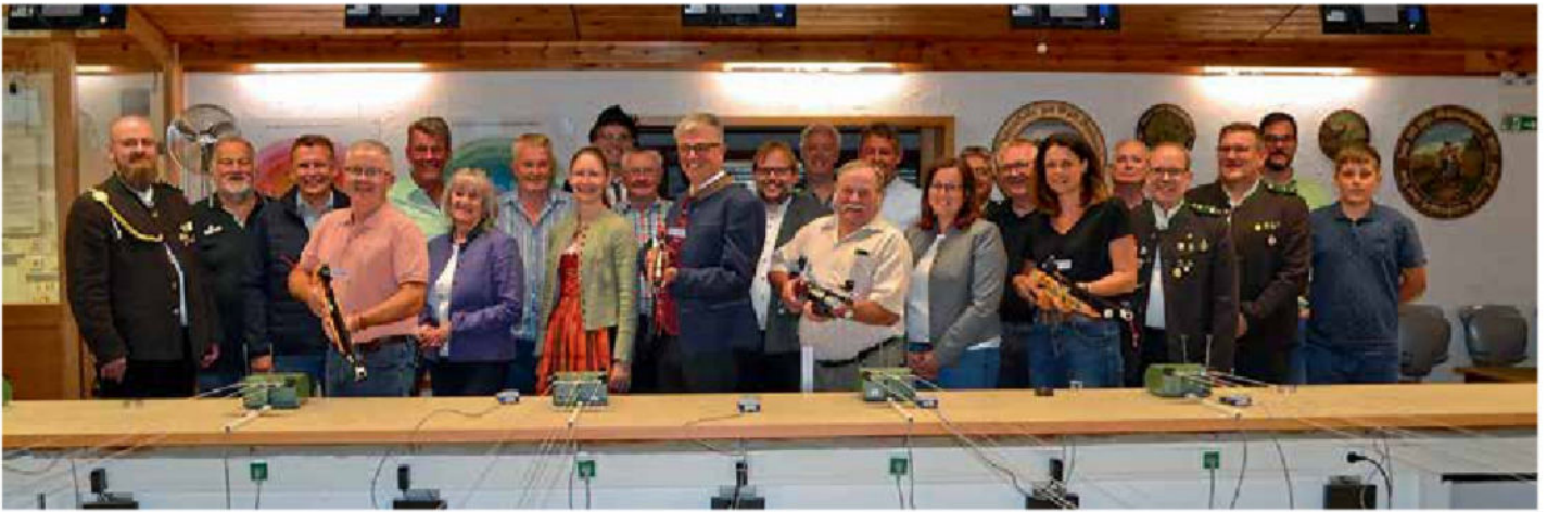
Zum traditionellen Eröffnungsschießen waren der Gemeinderat, die Ehrenmitglieder des Schützenvereins Hubertus Gaimersheim sowie die Vorstände der örtlichen Vereine eingeladen.