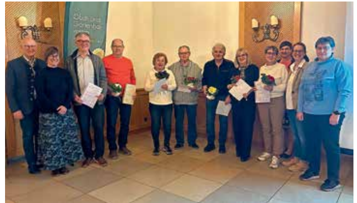
Bei der diesjährigen Jahreshauptversammlung konnten wieder zahlreiche Mitglieder für ihre Vereinstreue geehrt werden.