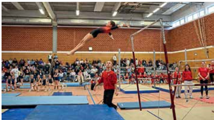
Viele Turner konnten persönliche Erfolge feiern, neue Elemente präsentieren oder ihre Leistungen deutlich steigern.

Der Gau Einzelwettkampf des Turngaus Donau ILM brachte 197 beeindruckende Turnerinnen in die Dreifachturnhalle der Mittelschule Gaimersheim. Unter der Wettkampfleitung von Christine Leixner und Jana Wanger sowie der örtlichen Organisation durch Lisa Kopitzki wurde ein reibungsloser und sportlich hochklassiger Wettkampftag ermöglicht. Die jüngste Teilnehmerin war gerade einmal sechs Jahre alt, die älteste Turnerin 50 – ein starkes Zeichen für die breite Altersvielfalt im Gerätturnen. Vertreten waren insgesamt zwölf Vereine aus dem gesamten Turngau, darunter der MTV Pfaffenhofen, TSV Großmehring, TSV Gaimersheim, TSV Jetzendorf, FC Gerolfing, TSV Neuburg, MTV Ingolstadt, SV Zuchering, TSV Elsendorf, TSV Reichertshausen, SV Wettstetten und TSV Ingolstadt Nord. Geturnt wurde ein Wahl Vierkampf an den Geräten Sprung, Stufenbarren, Schwebebalken und Boden. Die Pflichtübungen des Deutschen