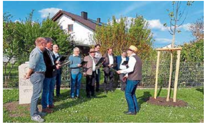
Die Lindenbaumsänger bei ihrem 1. Auftritt im Jahre 2023 vor ihrer neu gepflanzten Sängerlinde.

Die Lindenbaumsänger Lippertshofen laden am Donnerstag, 7. Mai 2026 um 18.45 Uhr zum Singen unterm Lindenbaum ein. Anlass für dieses Zusammenkommen ist der Jahrtag der Pflanzung der Sängerlinde an der Hofstettener Straße im Mai vor drei Jahren. Auch fand im Mai 2023 der 1. Geselligkeitsabend der Lindenbaumsänger statt.