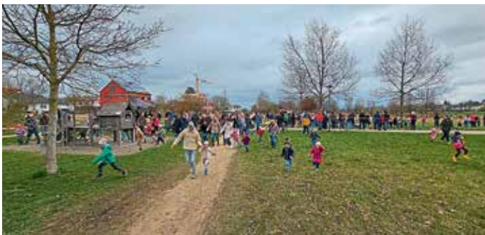
Viele Kinder waren wieder gekommen um die Ostereier zu suchen. (Fotos: get)

Die Junge Union Gaimersheim veranstaltete das traditionelle Ostereiersuchen am Karsamstag im Retzbachpark. Viele Kinder waren wieder zu dieser Veranstaltung gekommen und suchten fleißig die rund 500 bunten Ostereier, die der Osterhase zuvor im Park versteckte. Um jedem Kind die gleiche Chance zu geben, wurde der Park in zwei Bereiche, je nach Alter, abgetrennt und es durften auch nur maximal vier Eier mit nach Hause genommen werden. Nach dem Startschuss ging es los und die Kinder rannten, um eines der Eier zu erhaschen. In der Zwischenzeit konnten die Eltern entweder mitsuchen oder sich mit Kaffee und selbstgebackenen Kuchen erfrischen. Lange hat es nicht gedauert, bis auch die zwei Siegereier gefunden wurden. Vorsitzender Moritz Iberle durfte den beiden Siegern gratulieren, die sich über ein Osternest, gefüllt mit Eiern, Schokolade und einem Gutschein freuen durften. Die Kinder hatten jede Menge Spaß und trugen stolz ihre gefundenen Eier mit nach Hause. (get)