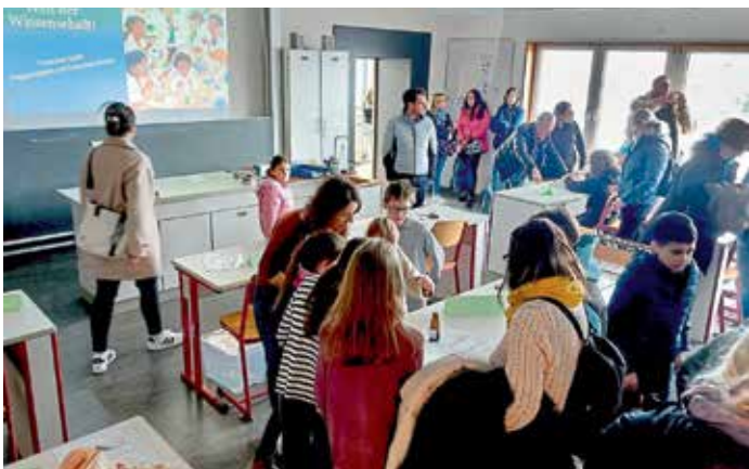
Die Schüler konnten die Kinder und Eltern an insgesamt 14 Stationen Einblicke gewinnen, wie beispielsweise im Physiksaal.