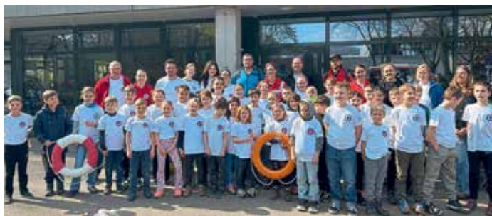
Gaimersheim mit vielen Medaillen, Urkunden, und Freude über den gelungenen Wettkampftag nach Hause.