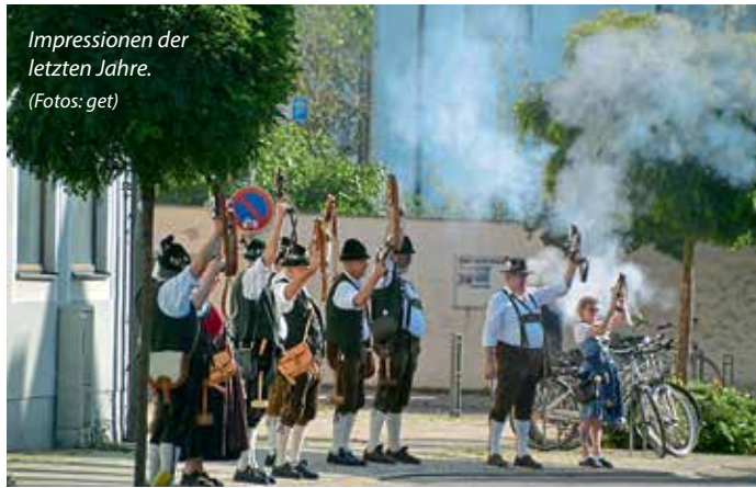
Impressionen der letzten Jahre.