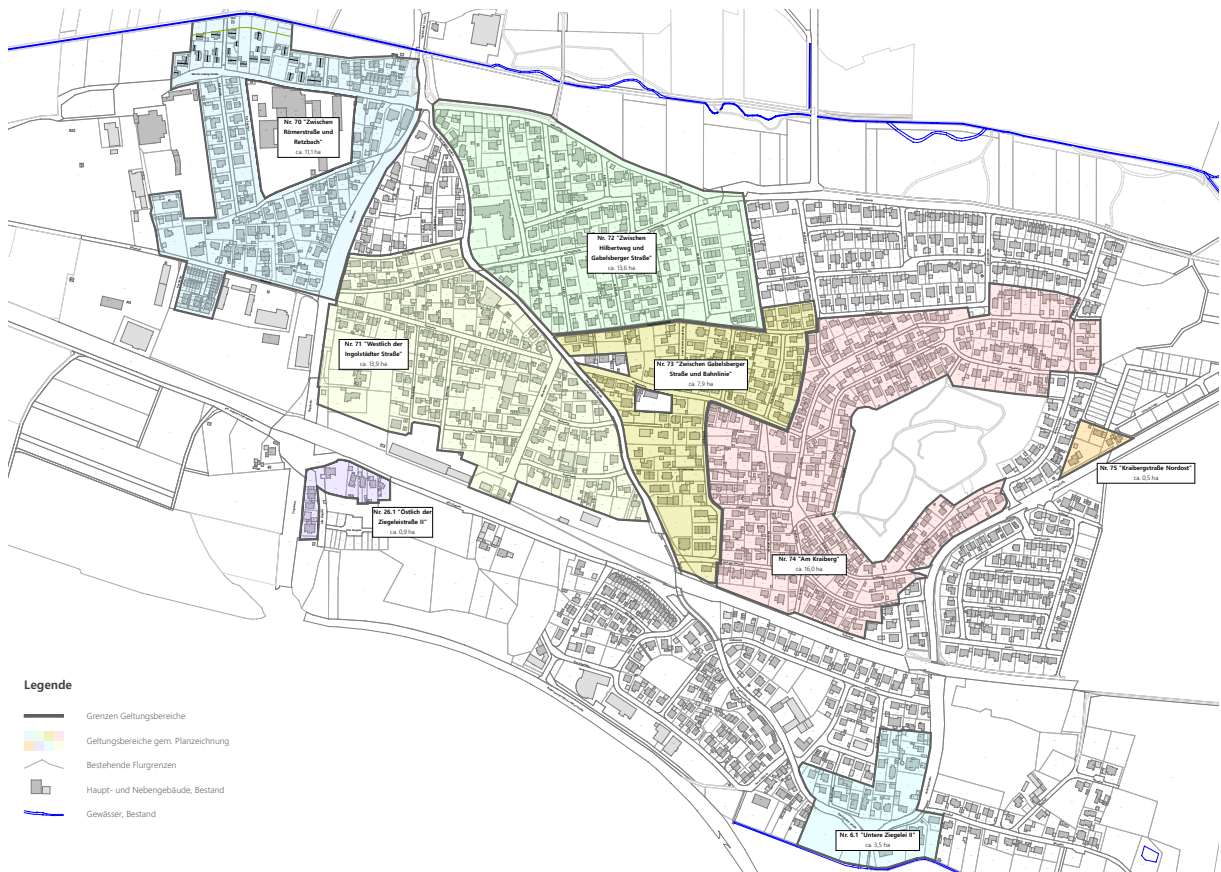
Abbildung 1: Übersichtsplan Bebauungsplangebiete im südlichen Ortsteil

Der Markt Gaimersheim hat sich aufgrund der guten räumlichen Anbindung, der guten Infrastruktur und seiner unmittelbaren Nähe zum Oberzentrum Ingolstadt zu einem sehr attraktiven Wohn- und Lebensstandort in der Region Ingolstadt entwickelt. Entsprechend hoch ist die Nachfragesituation nach Wohnungen und Wohnhäusern im Gemeindegebiet. Freiwerdende Gebäude und Grundstücke werden sehr schnell weiterveräußert und teilweise neu überplant mit der Zielsetzung, eine bessere Grundstücksausnutzung zu erwirken. Der Markt Gaimersheim zeigt sich gegenüber den Entwicklungen einer angemessenen Nachverdichtung grundsätzlich offen, möchte aber die spezifischen Eigenheiten des Ortes und das städtebauliche Gefüge der überwiegend lockeren Bebauung mit Einzelhäusern nicht überformen. Ziel der gegenständlichen Planung ist somit – in Verbindung mit den weiteren, im südlichen Ortsteil aufgestellten 7 Bebauungsplänen – diese Bereiche geordnet und verträglich städtebaulich zu entwickeln.