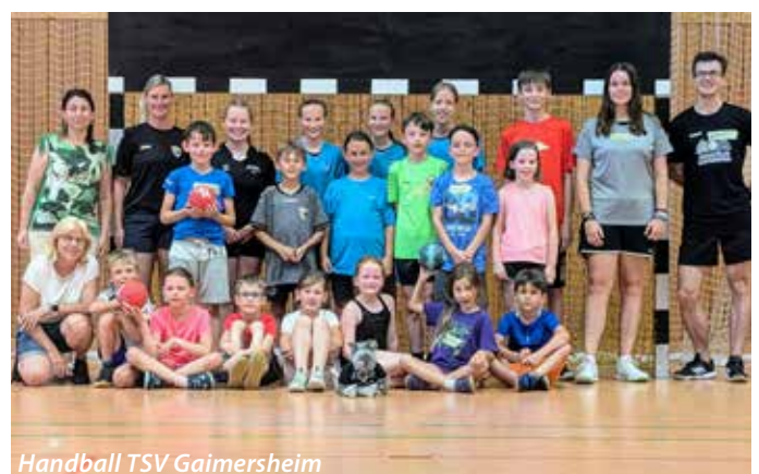
Handball TSV Gaimersheim