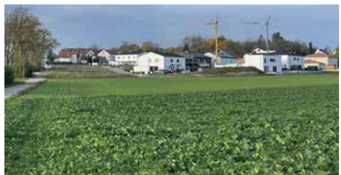
Baugebiet „Im Winkel“