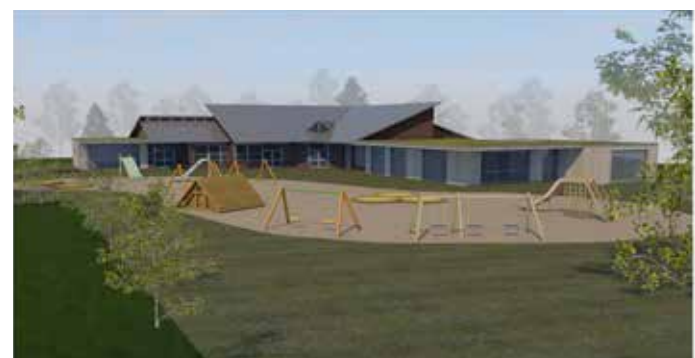
Sanierung und Anbau Kindergarten St. Rafael