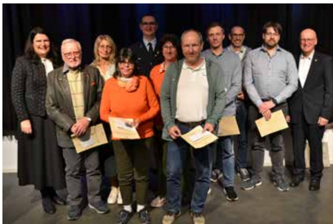
Funktionärszehrung goldene und silberne Marktnadel