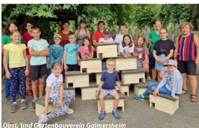
Obst- und Gartenbauverein Gaimersheim