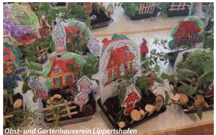
Obst- und Gartenbauverein Lippertshofen