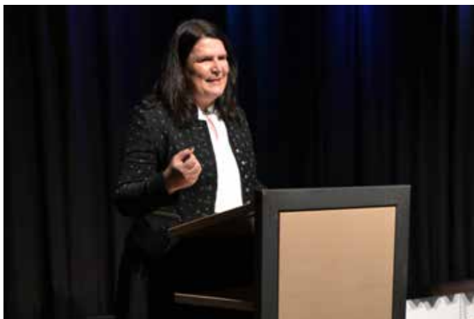
Würdigung des Ehrenamtes

Beim diesjährigen Ehrenamtsabend wurden wie in jedem Jahr Bürgerinnen und Bürger geehrt, die seit Jahrzehnten ein Amt in einer Organisation oder einem Verein ausüben sowie Personen, die sich auch ohne einer Organisation anzugehören, für die Mitmenschen engagieren.