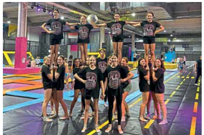
Team Smoke in der Maxx Arena bei München.

Durch das Erreichen der höchsten Tagespunktzahl auf einer offenen Cheer-Meisterschaft im April qualifizierten sich die Athletinnen aus Team Smoke von den „Red Hot Chilis“ des TSV Gaimersheim für die Teilnahme an einer Meisterschaft in Amerika, der „World Class“. Da der Auftritt in den USA durch verschiedene Faktoren (z. B. das Alter der Kinder sowie die durch den Saisonwechsel veränderte Teamzusammenstellung) nicht greifbar war, boten die Trainer und Trainerinnen den Mädels eine Alternative: ein Teamausflug in die MAXX Arena bei München, in der sich die Kinder sportlich austoben konnten. Mit diesem Tag wurde der Erfolg der letzten Saison nochmal in „alter Teamkonstellation“ gefeiert und die Leistung wertgeschätzt. Ein großer Dank gilt den Trainern und Trainerinnen, die diesen tollen Ausflug organisiert und – aufgrund des schlechten Wetters – spontan angepasst haben. (RHC)