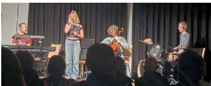
Die Indie-Pop-Band aus Freiburg machte Halt in Gaimersheim.

Mitreißende Texte, packende Melodien und treibende Beats, das sind Partyprivati aus Freiburg. Die vierköpfige Band machte Halt in Gaimersheim und begeisterte das Publikum mit Musik in einem nicht festgelegten Genre. Sie bewegen sich dabei irgendwo zwischen Jazz und Funk und lassen gelegentlich auch mal Anklänge von Latin oder Rock hören. Die Indie-Pop-Band spielt seit 2023 Konzerte im deutschsprachigen Raum. Kennengelernt haben sich die vier auf der Musikhochschule in Freiburg. Mit ihrer einzigartigen Kombination aus Gesang, Cello, Klavier und Schlagzeug schafften sie es die Herzen der Zuhörer zu berühren die zum Schluss eine Zuga-be nach der anderen forderten. (get)