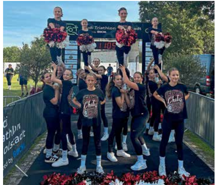
Team Smoke beim Triathlon Ingolstadt.

Aufgrund des Hochwassers wurde der ursprüngliche Termin des Triathlon Ingolstadt in den September verschoben. Bei herrlichem Sonnenschein trugen die Gaimersheimer Cheersportlerinnen zum Rahmenprogramm bei und zeigten den Ursprung des Cheersports: im Zieleinlauf wurden die Läufer und Läuferinnen durch Anfeuerungsrufe der „Red Hot Chilis“ nochmal zum Endspurt motiviert. (RHC)