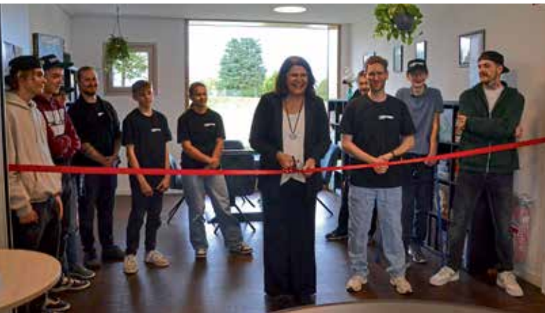
Nach dem Durchschneiden des roten Bandes galt die Ludothek für alle Besucher für eröffnet.