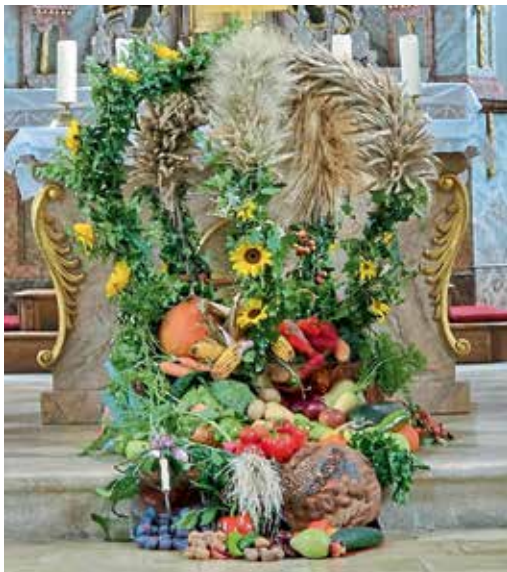
Der Frauenbund Lippertshofen gestaltete in diesem Jahr den Erntedankaltar in der Kirche St. Georg in Lippertshofen. Die fleißigen Helfer des Vereins bedankten sich herzlich bei den Spendern von Obst, Gemüse und Blumen. „Es ist echt schön, dass wir uns auf die Lippertshofener verlassen können.“ Text/Foto: get