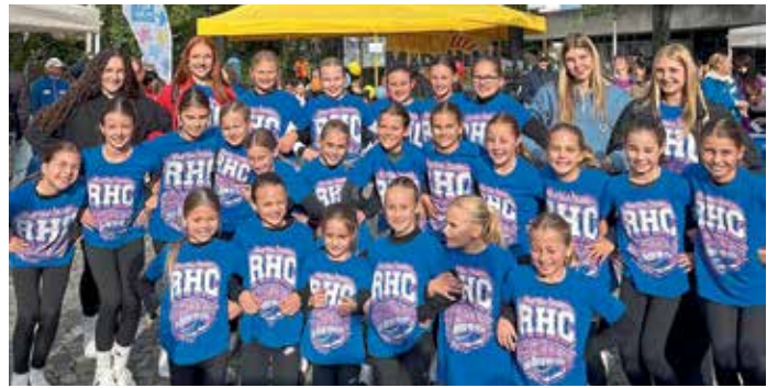
Team Sparks beim Weltmädchentag in Ingolstadt.