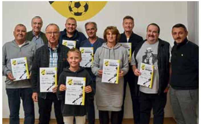
Der ST Kraiberg konnte wieder viele Mitglieder ehren.