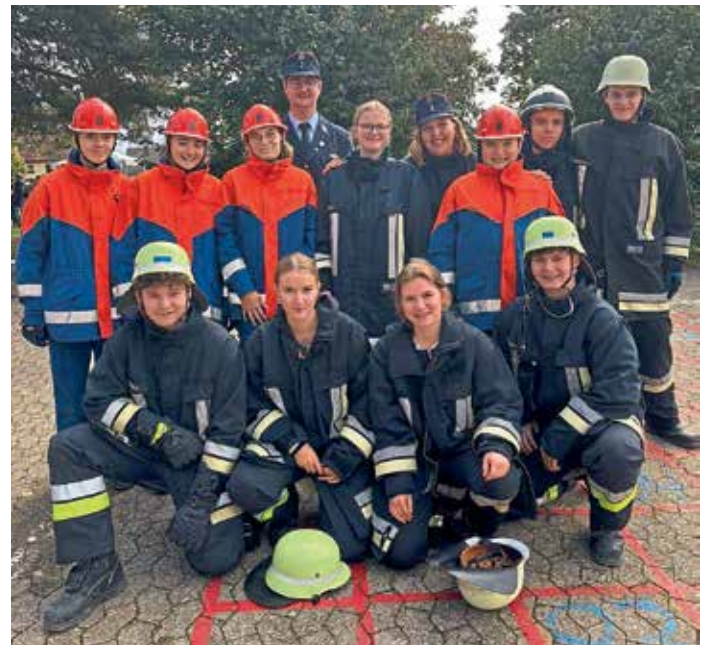
Die Gaimersheimer Jugendfeuerwehr konnte sich in diesem Jahr über Platz 26, 49, 52 und 70 freuen, in der Damenwertung erreichten sie Platz 11.