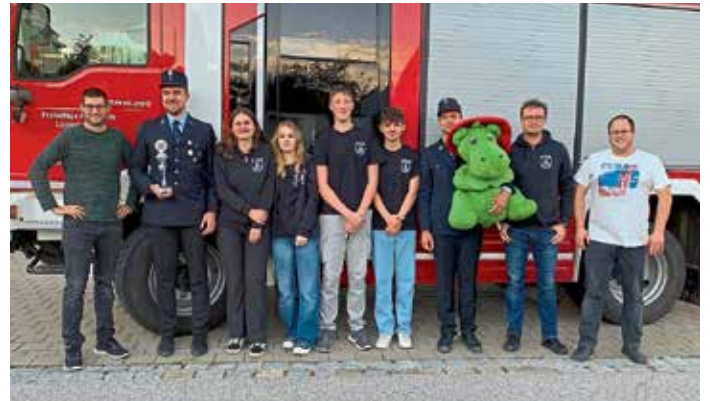
Die Feuerwehr Lippertshofen erreichte die Plätze 12, 16 und 40. In der Damenwertung stand Lippertshofen auf Platz 2.

An den verschiedensten Stationen mussten die Floriansjünger nicht nur Geschick und Schnelligkeit beweisen, sondern auch Teamarbeit.