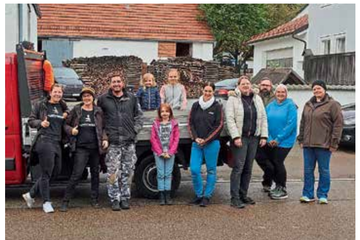
In Lippertshofen wurde wieder fleißig Altpapier gesammelt.