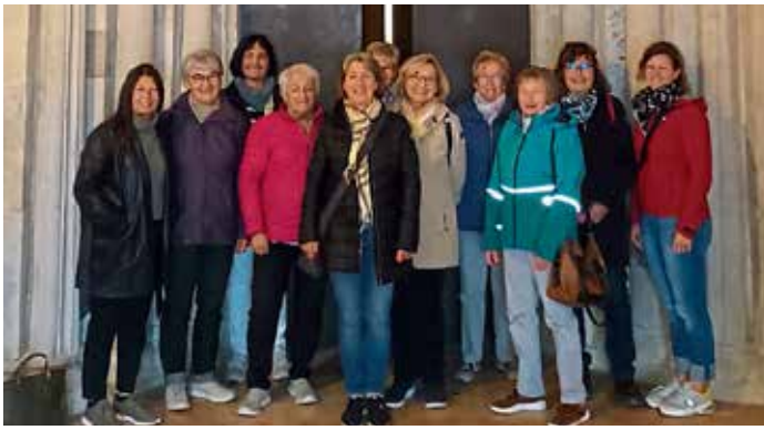
Der Frauenbund Lippertshofen unternahm einen gemeinsamen Ausflug nach Neuburg. Bei einer Stadtführung konnten sie die Schlosskirche und die Staatsbibliothek besichtigen. Nach einer kurzen Verschnaufpause ging es nach Bergen zur Wallfahrtskirche Heilig Kreuz. Nach der Besichtigung gingen sie zum Abschluss zusammen ins Landgasthaus Jurahöhe in Hard zum Abendessen. (get)