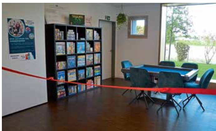
Die Ludothek ist für alle, ob jung oder alt, zu den im Text genannten Öffnungszeiten zugänglich.

Nachdem das Projekt Ende 2022 vom Gemeinderat genehmigt wurde, erhielten sie im Februar 2023 einen Sponsoring-Vertrag vom Spiel des Jahres e.V. Dadurch konnten direkt die ersten Spiele für die Ludothek erworben werden. Die Jugendlichen wollten das Geld für Möbel und weitere Spiele eigenständig aufbringen. Ursprünglich war geplant, die Ludothek bereits im Sommer 2023 zu eröffnen, jedoch zog sich die Finanzierungsphase hin. „Wir wollten Geld durch einen Spendenaufruf und eine Crowdfunding-Aktion sammeln. Letzteres gestaltete sich aufgrund rechtlicher und bürokratischer Hürden schwierig, wodurch sich die Finanzierungsphase verzögerte. Doch trotz anfänglicher Rückschläge war die Finanzierungsphase letztendlich ein voller Erfolg. Am Ende standen uns 2.837,70 € zur Verfügung, zusätzlich erhielten wir über 50 Spiele als Spenden von verschiedenen Spielverlegern“, so Arne Proctor freudig.