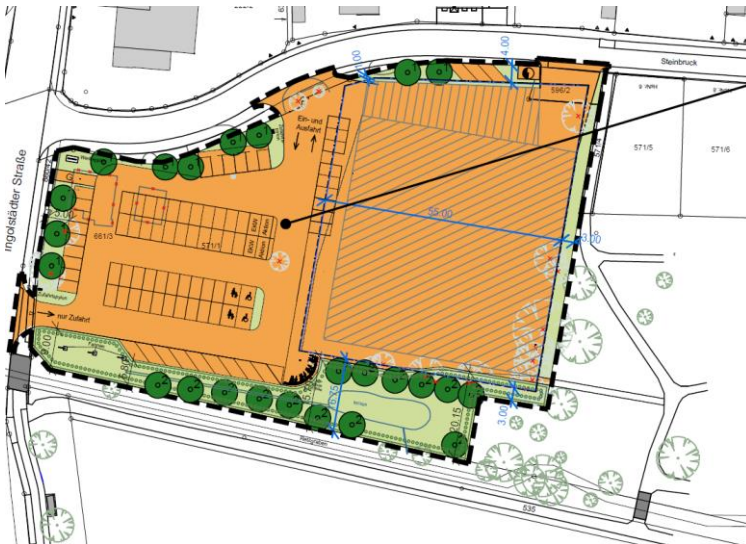
Lageplan zum Geltungsbereich des Bebauungsplanes Nr. 38.1 (schwarz umrandet)

Der Geltungsbereich des Bebauungsplanes umfasst die Grundstücke mit den Fl.Nrn. 571/1, 596/2 und 661/3 der Gemarkung Gaimersheim zwischen den Straßen „Steinbrück“ der „Ingolstädter Straße“ und dem Retzbach.